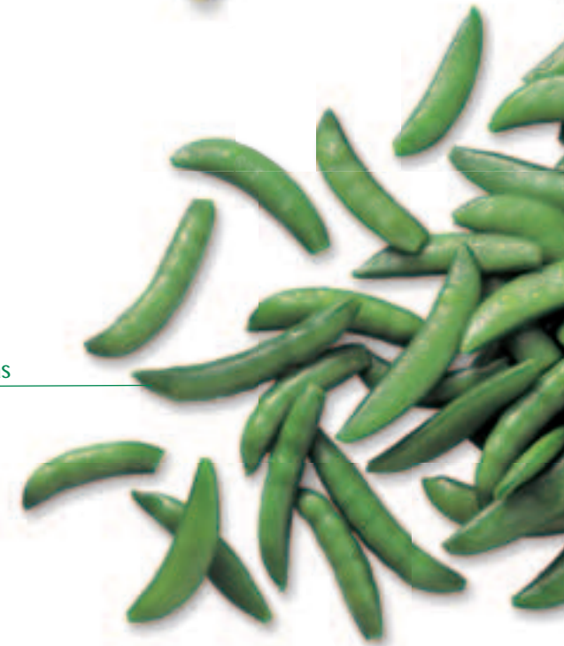
Sugar snap peas