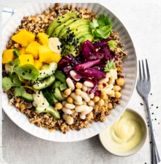
Poke bowl met tricolore linzen en peulvruchten

Reeds gekookt en dus grote tijdwinst in de keuken