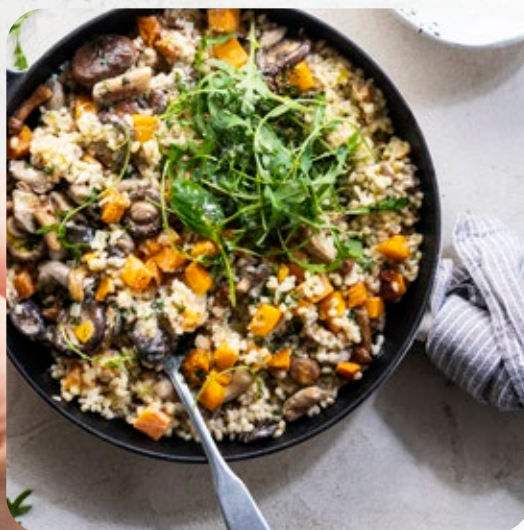
Risotto met gerst, butternut en woudpaddenstoelen