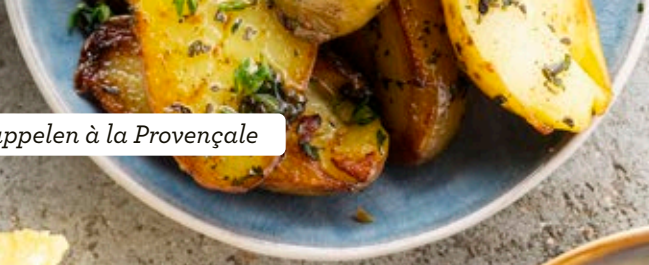
Aardappelen à la Provençale