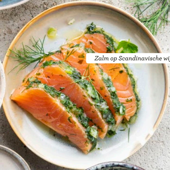
Zalm op Scandinavische wijze